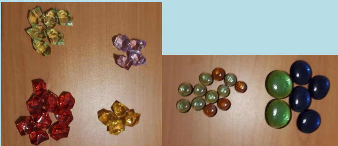
Игра «Продолжи узор»

Предложите ребенку продолжить начатый вами узор. Это упражнение развивает память, умение воспроизводить последовательность элементов.